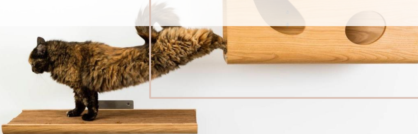
Nella foto: Cat60 di Brando Design